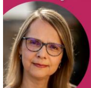
@Marie-Stéphane Maradeix ESSEC BUSINESS SCHOOL CHAIRE PHILANTHROPIE

Une rigueur méthodologique associée à une connaissance fine des enjeux associatifs.