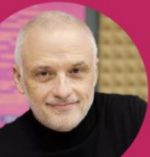
@Patrice Douret LES RESTOS DU CŒUR

Ce label exigeant est une invitation à améliorer sans relâche la qualité de nos missions.