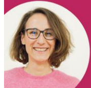
@Claire Thoury LE MOUVEMENT ASSOCIATIF

Un partenaire essentiel pour soutenir, accompagner et valoriser les associations.