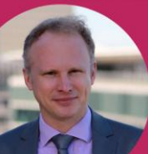
@Thibaut de Saint Pol MINISTERE DES SPORTS, DE LA JEUNESSE ET DE LA VIE ASSOCIATIVE

20 ans de collaboration au service de la montée en compétences des acteurs associatifs en France.