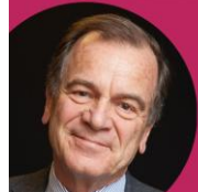
@François Debiesse ADMICAL

20 ans d'engagement au service du progrès des associations et de leur impact sur la vie sociale et l'intérêt général.